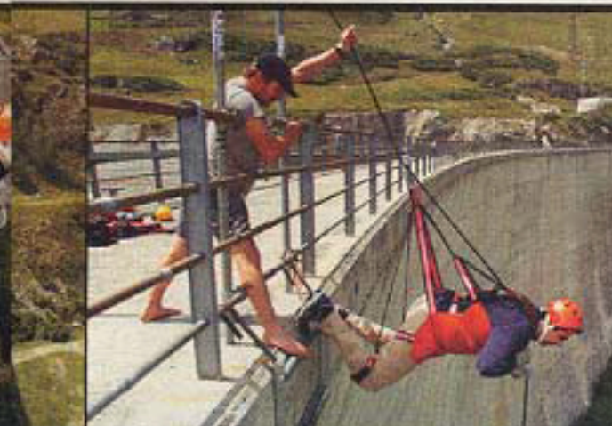
LE GRAND SAUT Darius Rochebin, la tête la première, bascule dans les bras du vide.